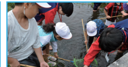
小高連携 水辺の生き物探し