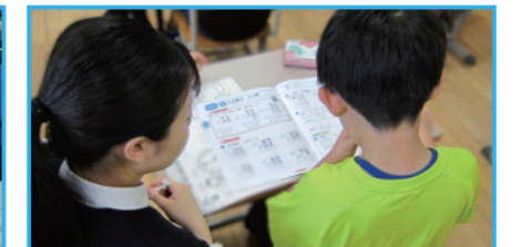
高校生ミドルティーチャー