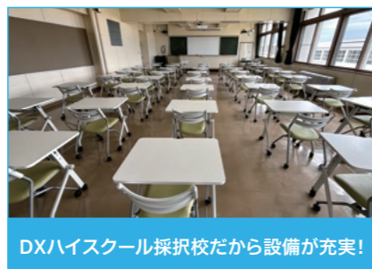
DXハイスクール採択校だから設備が充実!