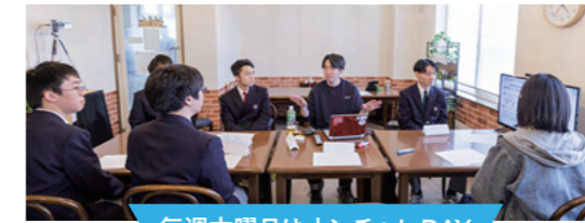
毎週木曜日はオンチャレDAY

毎週木曜日 16:00~18:00 まで、オンチャレ生は町内の「かしわ Cafe」に集まって勉強や面談をします。普段は自宅で勉強し、週1回、一緒に頑張る仲間と集まることで勉強するモチベーションが高まります!