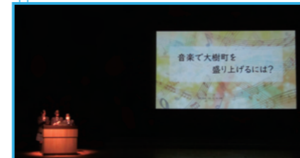
大樹町教育の日発表会

さまざまな地域活動に参加し、人との関わりや実体験を通して、地域や社会のために行動しようとする心と姿勢を育みます。