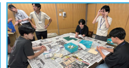
JAXA エアロスペーススクール