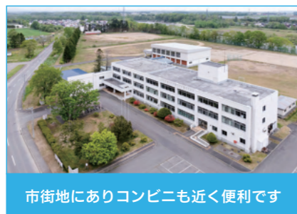
市街地にありコンビニも近く便利です