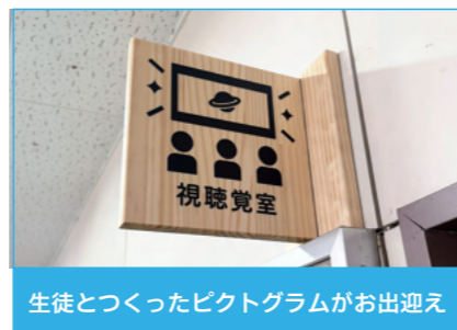
生徒とつくったピクトグラムがお出迎え