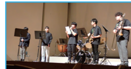
コスモスコンサート