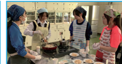
大樹町の給食考案